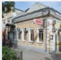
Лечебно- диагностический центр «Биомед»