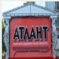
Спортивно- оздоровительный комплекс «Атлант»