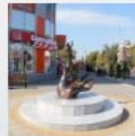
Скульптура «Ладонь с Гермесом»