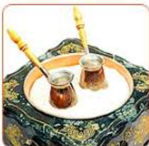
Кофе на песке