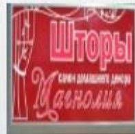
Сеть дизайн-салонов «Магнолия»