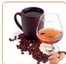
Кофе с алкоголем