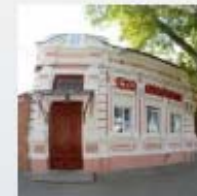
Стоматологический центр «Фабрика улыбок»