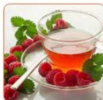
Чай с ягодами