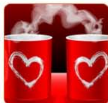
Чай в кружках